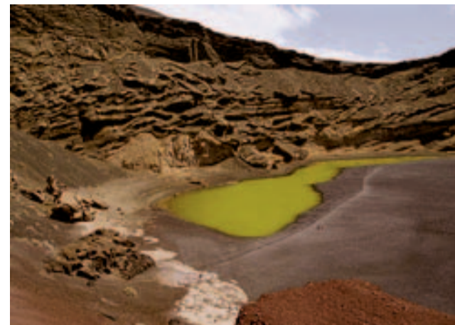
Lanzarote is van top tot teen vulkanisch; alleen de vulkanische activiteit is op het ogenblik beperkt

Onze huwelijksreis duurde drie weken dus er was nog wat tijd voor echte 'actie'. Op naar Stromboli, een klein eilandje op ruim vijftig kilometer van de Siciliaanse