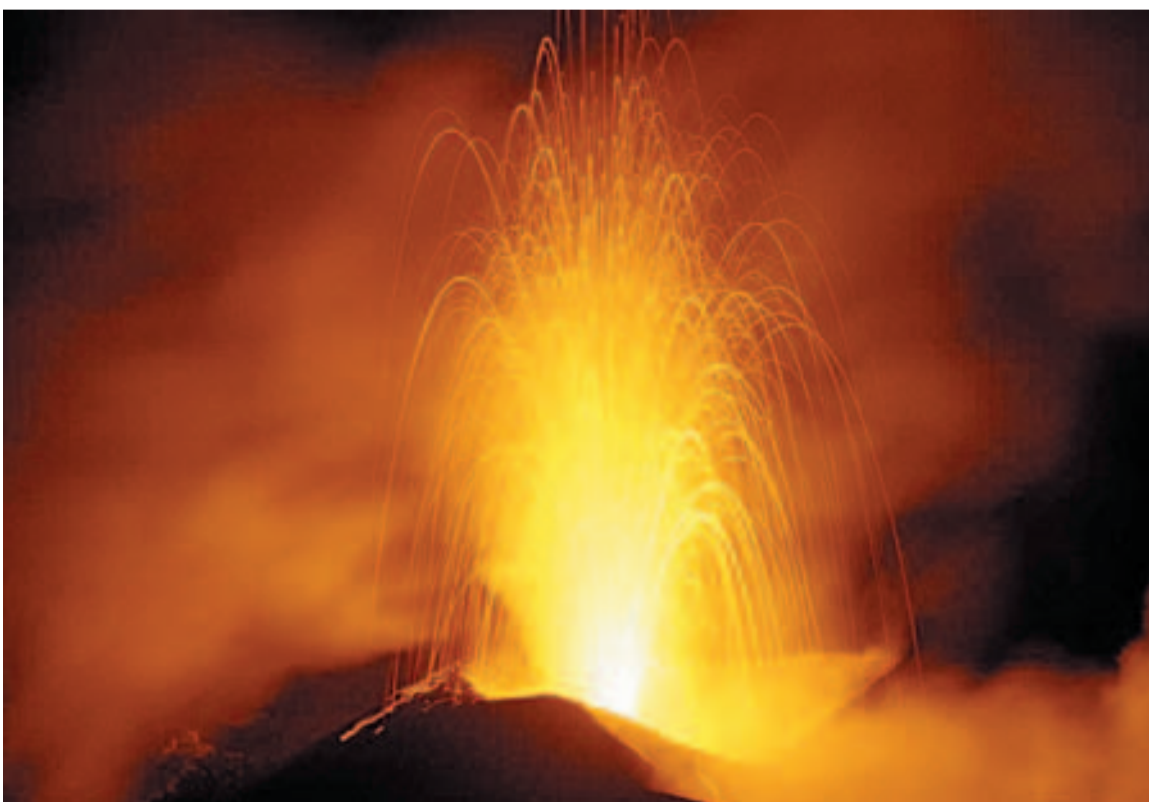
De Stromboli is één van de best benaderbare actieve vulkanen ter wereld