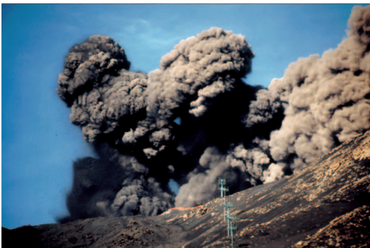
In oktober 2002 begon de Etna opnieuw te rommelen

Ondertussen had ik me verder verdiept in vulkanisme en vulkanologie en de interesse in werkende vulkanen werd alleen maar groter. In oktober 2002 begon de Etna opnieuw te rommelen. De Etna is de laatste tien jaar van een rustige vulkaan uitgegroeid tot een flink actieve. Net als in 2001 begon de activiteit niet op de top maar meer op de flanken. Lava zoekt de kortste weg en dat gaat bij de Etna richting de flank. Welke kant de lava uitgaat is afhankelijk van waar de eerste zwellingen en scheuren ontstaan. Ik liep al dagen rond met de vraag "zal ik er heen gaan?" Op een gegeven moment dacht ik "niet zeuren, gewoon gaan." Ik ben toen fanatiek op internet gaan grasduinen en heb de vraag gesteld: "wie heeft er ervaring met de Etna en zijn er mensen die er binnenkort naar toe gaan?" Als toerist hoef je er niet aan te denken om te gaan, want tijdens een eruptie sluit de Italiaanse carabinieri de Etna volledig af. Na drie dagen intensief surfen op het Web kon ik eind oktober met een ploeg ervaren amateur-