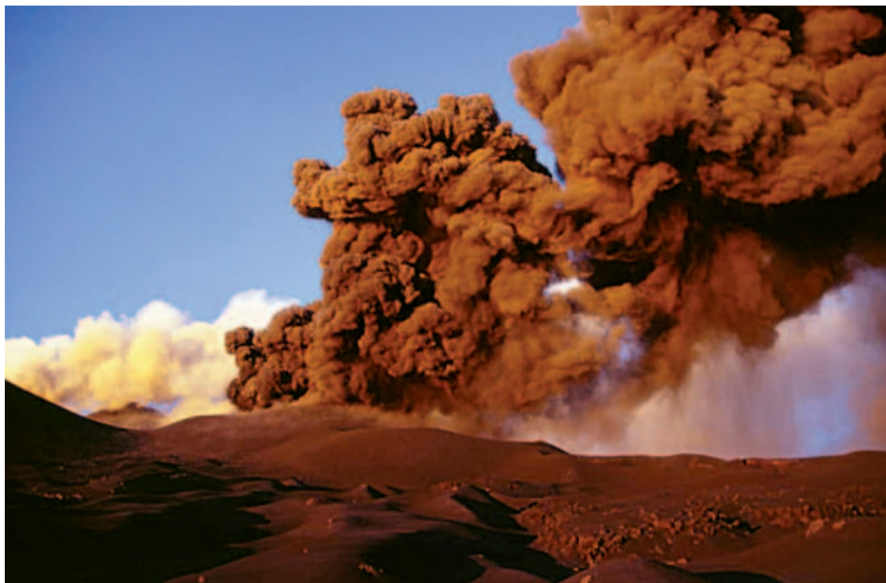
De Etna is de laatste 10 jaar van een rustige vulkaan uitgegroeid tot een flink actieve

We hebben tot het donker gewacht, want overdag zie je niets anders dan grote aswolken. Als het donker wordt