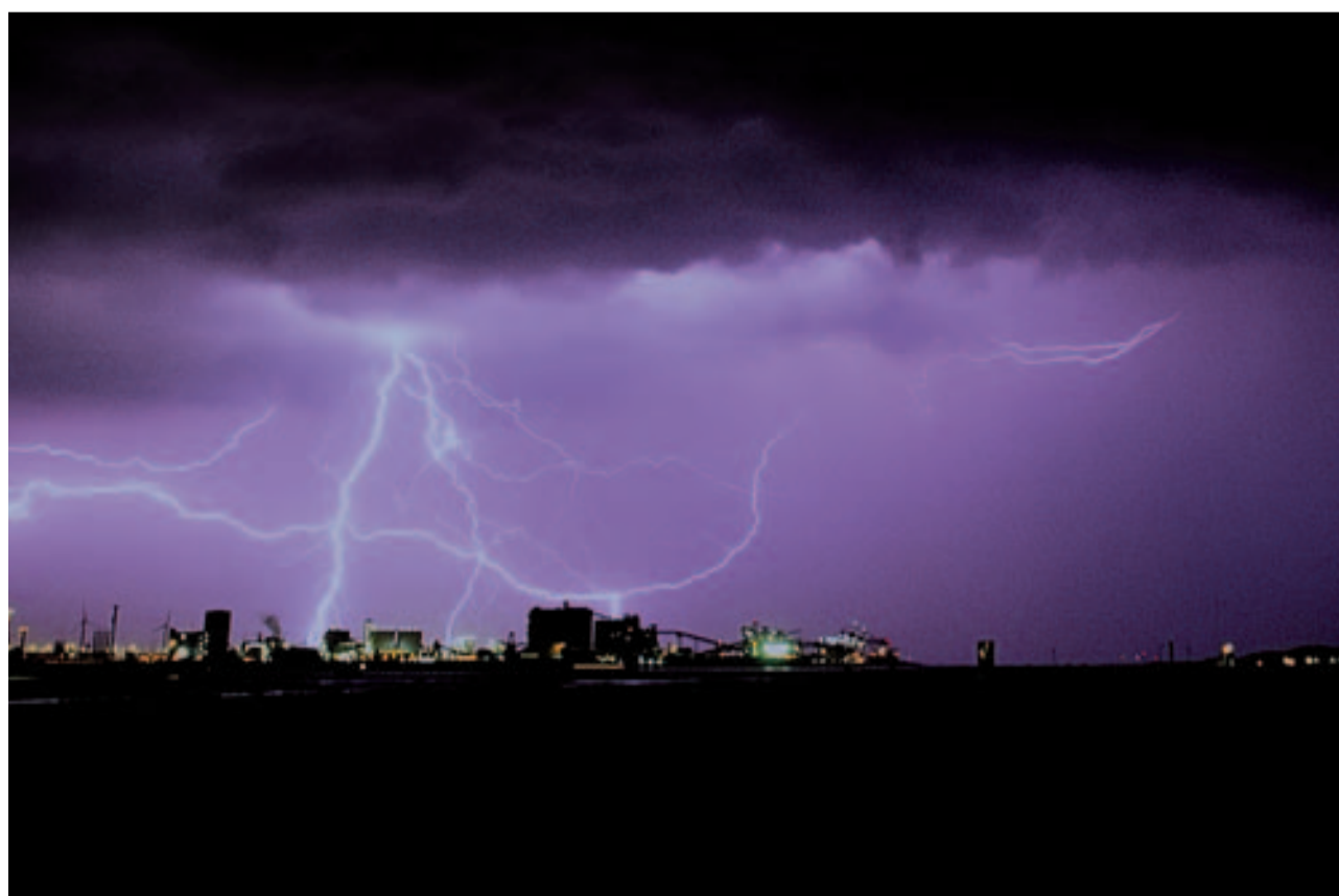
Onweer boven de Landtong Rozenburg

De foto's zijn te bezichtigen vanaf maandag 27 oktober 2003 Van maandag tot vrijdag van 11.30 uur – 17.30 uur in het bedrijfsrestaurant van Huntsman. De toegang is gratis.